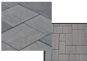
Calepinages / Verlegemuster

Varia ist ein modularer Pflasterstein, der aus 3 verschiedenen, auf der Palette vorgemischten, Formaten besteht. Die vielfältigen Masse bieten interessante Muster und erleichtern gleichzeitig das Verlegen, da die Lagen bereits auf der Palette zusammengestellt sind. Es wurden 9 neue Farben in geflammter (nuancierter) oder gestrahlter Oberfläche entwickelt. Die 6 cm starken Varia-Steine eignen sich besonders für private Außenanlagen.